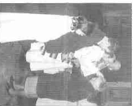
La communion : un moment fort de l'Eucharistie.

blée. Après la prière indispensable à cette communion spirituelle et la bonne marche des travaux, le président ouvrait la séance après avoir bien évidemment salué l'assistance et avoir exprimé sa joie d'être au milieu des hospitaliers et des hospitalières. Il dressait un tableau complet des diverses manifestations et des événements qui ont ponctué l'année écoulée. Il annonçait les dates qui ont été retenues pour les pèlerinages : le diocésain, modifiés pour