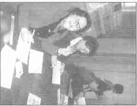
L'accueil par les administratifs avec le sourire.

Après l'accueil par l'équipe des Montois et des différents responsables pour quelques for-