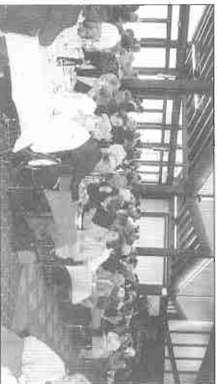
Le repas en commun : un grand moment de joie.