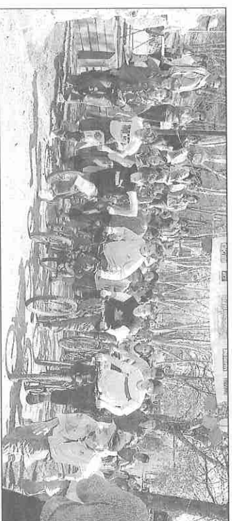
Le départ de la course. Jusqu'à l'an dernier, la manifestation portait le nom de Défi Terre d'Avenir. La banderole est restée...

A l'intérieur de la grange, une exposition riche en documentation sur les migrations européennes ainsi que sur la culture et les traditions roms montrait tout le travail accompli par ces jeunes capables de s'ouvrir à la différence pour mieux comprendre d'autres façons de vivre.