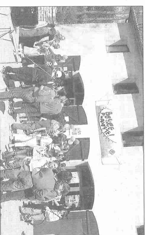
Après l'effort le temps de la détente autour de la Grange.

MERCI À TOUS CEUX QUI AIDENT NOTRE JOURNAL PAR LEUR ABONNEMENT DE SOUTIEN